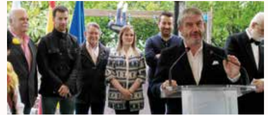
O Alcalde recordando a Carlos Casares

Celebramos o Día das Letras Galegas, o 17 de maio, na praza do Campo da Escola en Insua, Viñas. Carlos Casares foi o autor homenaxeado nesta edición; o Alcalde e o seu Equipo de Goberno presidiron o acto que contou tamén cos sons da Escola de Gaitas San Pantaleón e coas voces do Orfeón Alcoa-Inespal.