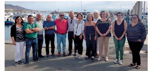
Os membros da directiva do Galp-Golfo Ártabro Norte e do Galp-Sector Pesqueiro (ADERLAN)

Con esta visita o Alcalde espera trasladar ideas e proxectos para os emprendedores de Paderne relacionados co sector do mar e aportar así beneficios ó tecido social e económico do Concello.