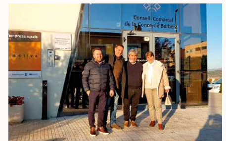
No Consell Comarcal

O Alcalde recolleu ideas útiles para a posta en marcha e implantación de empresas neste espazo a rehabilitar en Souto co fin de que sirva como punto de encontro da actividade económica de toda a Comarca e posta en valor do gran potencial dos produtos de Paderne.