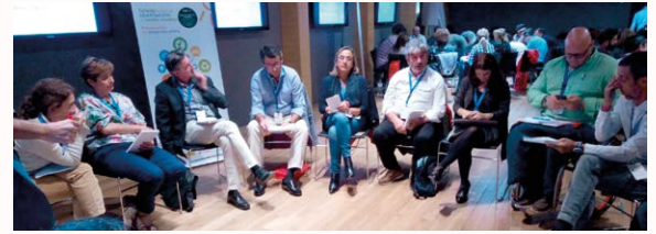
O Alcalde participando nun dos talleres

O Alcalde aproveitou para recoller as propostas que mellor se adaptan a Paderne e comprobou que as medidas que se están a tomar, tales como o cambio de farolas no alumeadado público por unhas de baixo consumo ou as accións adoptadas para a mellora na reciclaxe, van en consonancia coa conservación do medio ambiente dun concello Reserva da Biosfera.