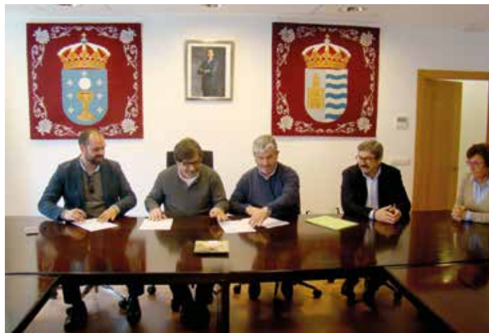
Sinatura, por parte dos alcaldes de Miño, Pontedeume e Paderne, do acordo de colaboración para a solicitude do obradoiro "Sociosanitario II"

Tamén se asinou, este pasado día 24 de marzo, o Convenio de colaboración para a solicitude do obradoiro de emprego "SOCIOSANITARIO II" a desenvolver entre os concellos de Miño, Pontedeume e Paderne na especialidade de "Atención socio sanitaria a persoas dependentes en institucións sociais" para 20 alumnos.