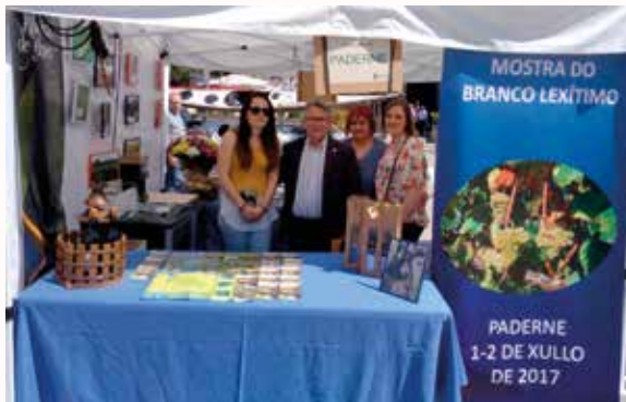
Stand do Concello no que se promocionaba a Mostra do vindeiro 1 e 2 e o Branco Lexítimo de Paderne