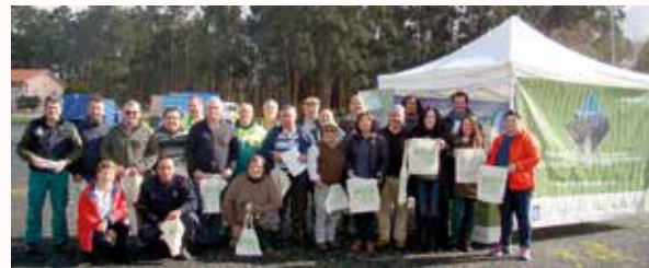
O Alcalde, acompañado polas persoas que participaron nesta xornada

O 21 de marzo, o Concello de Paderne realizou unha xornada de concienciación sobre o coidado do medio ambiente na que participaron diversos colectivos do Concello moi implicados na limpeza e coidado do noso entorno como son o Coto de Caza, a Sociedade de Pescadores, a Confradía de Pesca e Marisqueo, a Asociación de Veciños de Quintas, a Empresa de recollida de lixo, Protección Civil, persoal do Concello, concelleiros e o propio Alcalde.