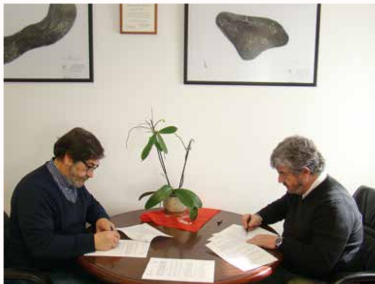
Os Alcaldes de Miño e Paderne na sinatura de ambos Convenios

Deste xeito, entenden que deben procurar medidas para unha maior protección, defensa e conservación integral do medio rural e, fundamentalmente, da súa biodiversidade.