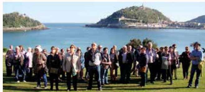
Vista da bahía da Concha desde os xardíns do Palacio de Miramar