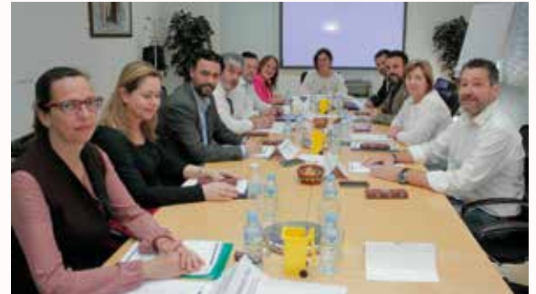
O Alcalde na reunión do Consello Rector do Goberno da Rede de Gobernos Locais + Biodiversidade

Varias visitas técnicas completaron estes intensos días de intercambio de experiencias que afectan a tódolos concellos a nivel estatal.