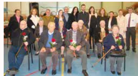
Unha foto de grupo despois do acto de homenaxe ós maiores

Celebrouse o pasado 29 de abril; unha cita pensada especialmente para os maiores ós que o Alcalde convoca cada ano no polideportivo municipal. Despois das palabras do Alcalde tivo lugar a Santa Misa celebrada polos dous párrocos do Concello e cantada pola Coral Albeiro de Velouzás, segueulle o acto de homenaxe ós maiores e a comida tralacal se realizou o sorteo de regalos.