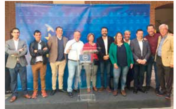
Grupo de traballo das xornadas "Especies Exóticas Invasoras: risco para a biodiversidade"

Celebráronse o día 18 de abril en Madrid. Ademais de decidir os proxectos e actuacións a abordar durante este 2018, déronse a coñecer os avances realizados polos grupos de traballo, a nova páxina web da Rede e os contidos dos acordos de colaboración asinados. As xornadas resultaron ser un foro moi interesante no que, coas aportacións dos expertos presentes, se valoraron as mellores alternativas para o control e erradicación das especies invasoras.