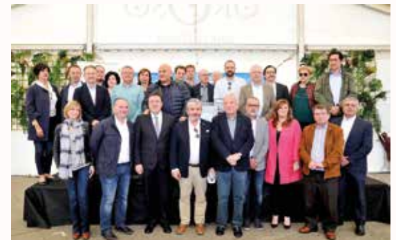
O Presidente da Deputación da Coruña, a Directora de Turismo de Galicia e os alcaldes dos 18 municipios polos que pasa o Camiño Inglés

Tivo lugar este pasado día 5 de maio. Os alcaldes e representantes dos 18 municipios polos que pasa o Camiño Inglés estiveron na Praza de Irmáns García Naveira de Betanzos promocionando esta ruta de gran importancia para os concellos polos que discorre pola súa riqueza cultural e económica. O Concello de Paderne, xunto con outros atractivos que ofrece ó visitante, destacou a importancia do seu Branco Lexítimo.