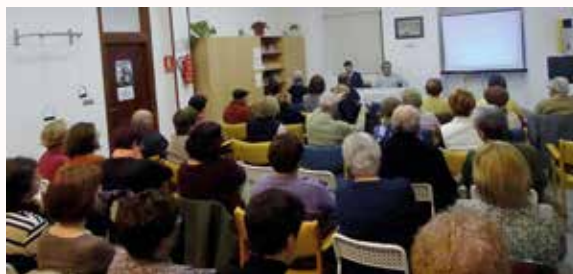
O Alcalde e o Concelleiro na presentación do acto