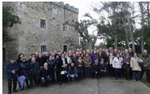
Foto de grupo no Castelo de Santa Cruz