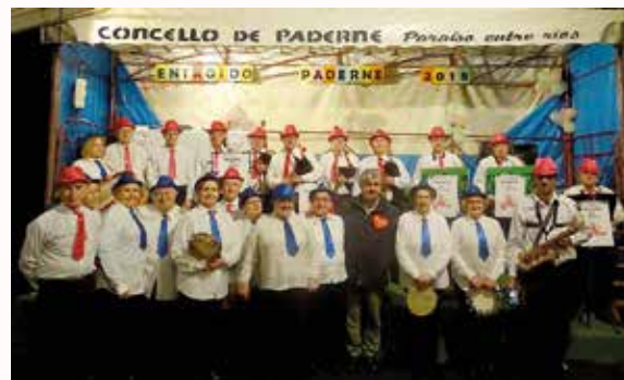
O Alcalde co grupo de alumnos da UNED e o seu profesor

Tratouse dunha soa sesión de hora e media, onde se trataron, de forma sinxela e accesible, temas relacionados coa comprensión da factura da luz, como optimizala segundo as necesidades de cada familia, opcións para pequenos cambios nas vivendas que supoñan un aforro enerxético e o bono social.